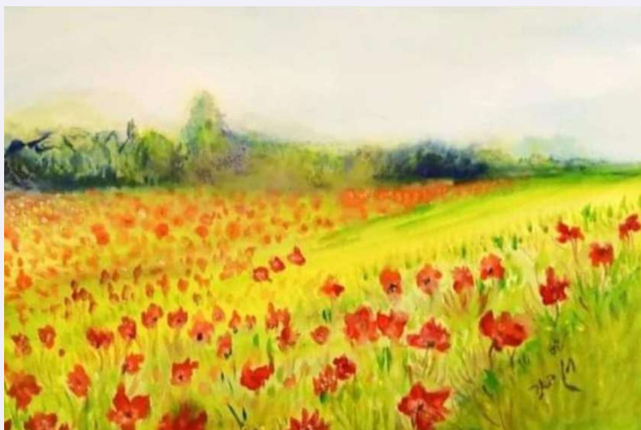
חן באר, דרום אדום פברואר 2022, צבעי מים על קאנבס