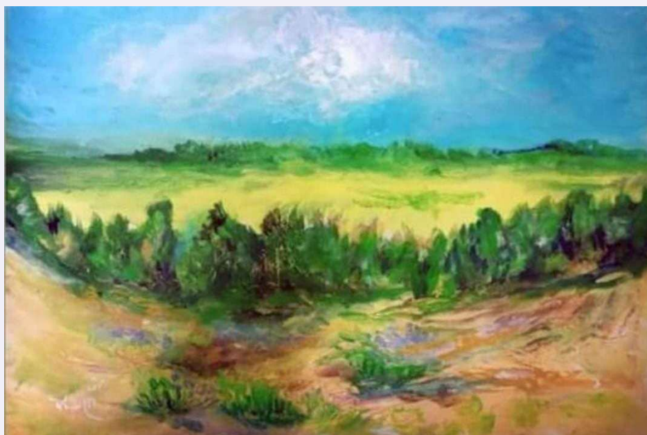
חן באר, הרבה כאב שיש בו יופי שדות זמרת - כפר מימון, אקריליק על בלוק, 2022