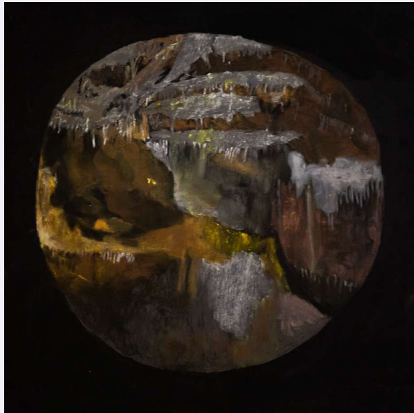
יעל בן שלום, תהומות, 2020, פחם, גרפיט ופסטל על עץ לבוד