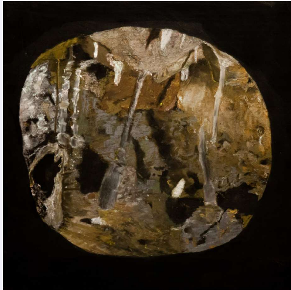
יעל בן שלום, תהומות, 2020, פחם, גרפיט ופסטל על עץ לבוד