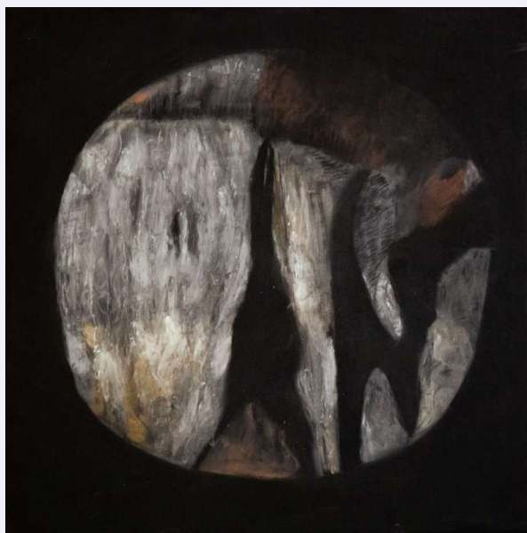
יעל בן שלום, תהומות, 2020, פחם, גרפיט ופסטל על עץ לבוד