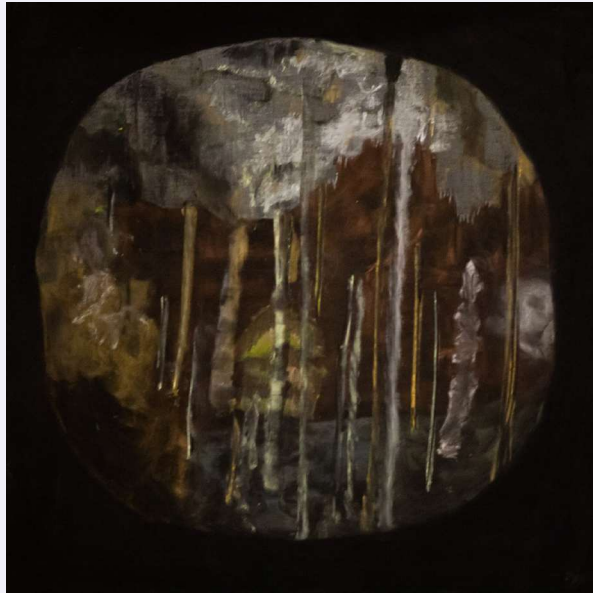
יעל בן שלום, תהומות, 2020, פחם, גרפיט ופסטל על עץ לבוד